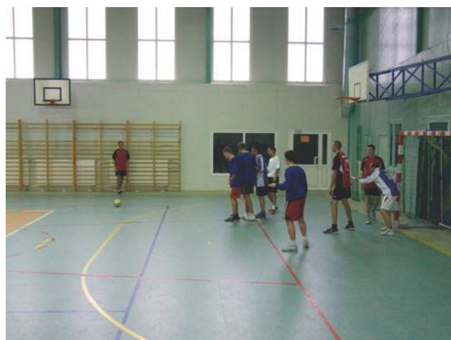
A tak walczyli inni

Biuletyn Informacyjny Gminy Jonkowo „Z Rady i Urzędu”