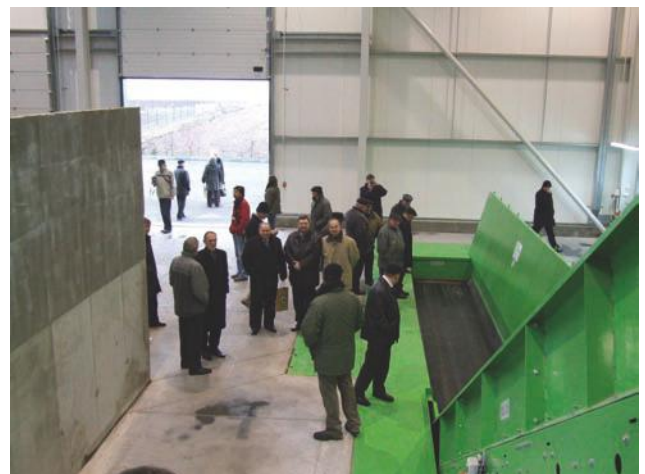
Tutaj trafią śmieci z naszej gminy i z gmin innych członków Związku Czyste Środowisko