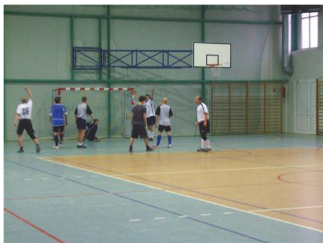
Tak strzelali bramki zwycięzcy