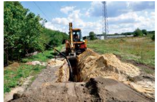
Odcinek kanalizacji w wykonaniu ZGK

studnie wykonane zostaną z tworzywa sztucznego o średnicy 1 m. W miejscach przejść przez drogę wojewódzką nr 527 zaprojektowano przejścia w rurach osłonowych stalowych średnicy 323,9x8,0mm.