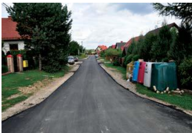
Wyremontowana nawierzchnia drogi w Gutkowie

wpustów deszczowych. Szerokość remontowanej drogi wynosi 3,5 m, (na łukach droga ma 4,5 m) z