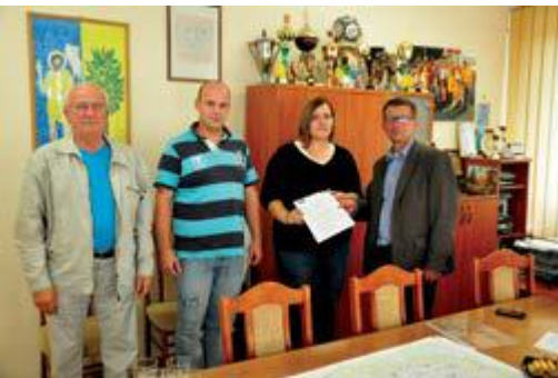
Podpisanie umowy z wykonawcą

Koszt inwestycji zamknie się kwotą prawie 800 tys. zł, z czego 50% dofinansowane zostanie z Programu Rozwoju Obszarów Wiejskich, działanie 321, Podstawowe usługi dla gospodarki i ludności wiejskiej.