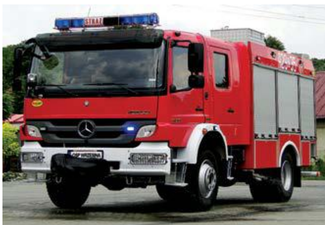
Średni wóz ratowniczo-gaśniczy Mercedes Benz Atego

Kabina pożarnicza wykonana została z materiałów kompozytowych z aluminiowym poszyciem skrytek (gładka blacha anodowana). Pojazd posiada łącznie siedem skrytek (3+3+1). Schowki na sprzęt i przedział autopompy wyposażone zostały w oświetlenie LED, umiesz-