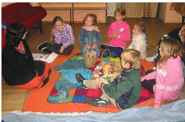
Podczas magicznych zajęć w N. Kawkowie