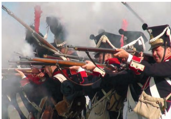
Napoleońska piechota liniowa

Codziennosc wielkiego wodza na Warmii. Audycja odbyła się w ramach programu Olsztyńskiego Wehikułu Czasu. Nagranie, podczas którego krótki referat przygotował dr Sławomir Skowronek