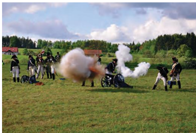
Artyleria pruska w akcji