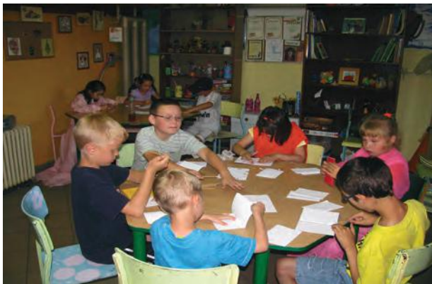
Tak wypoczywaliśmy w ubiegłym roku