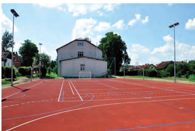
a tak jest....

Oświetlenie boiska zostało zaprojektowane na masztach stalowych z dwu- i cztero-ramiennymi wysięgnikami, wyposażonymi w odbłyśniki asymetryczne i halogenowe źródła światła o mocy 250 W każdy.